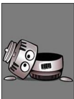
Uit elkaar gehaald apparaat