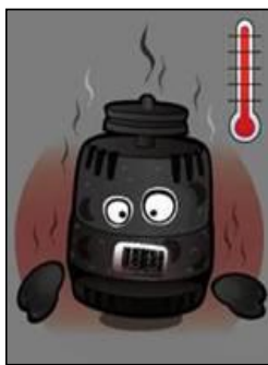
Zware corrosie of verbrand