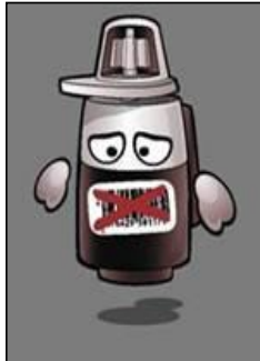
Niet in de retourlijst voor behuizingen