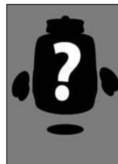
Geen identificatie op de eenheid