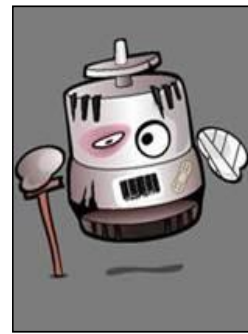
Ontbrekende of beschadigde onderdelen